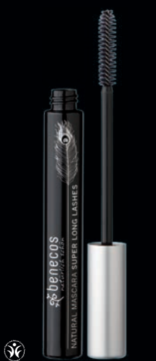
NATURAL MASCARA SUPER LONG LASHES Augnhárin virka lengri og greiðast vel.