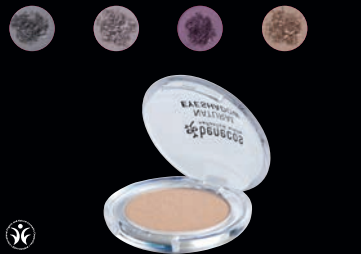
NATURAL AUGNSKUGGAR STAKIR · Fallegir glansandi augnskuggar fyrir öll yndislegu augnablíkin.