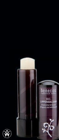
LÍFRÆNN VARASALVI Óflug vörn sem skilar silkimjúkum vörum.