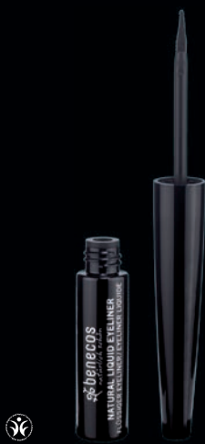
NATURAL FLJÓTANDI EYELINER Endist lengi. Með mjóum en nákvæmum bursta svo auðvelt er að gera finar eða breiðar línur – leyfðu hugmyndafluginu að ráða.