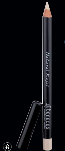
NATURAL KAJAL skarpari augu! Hvítur augnblyantur sem gerir augun meira áberandi, þau virka stærri og skærari. Mjúk, rjómakennð áferð auðveldar notkun.