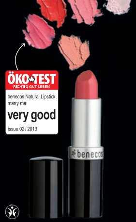
NATURAL VARALITUR Ver varinnar. Kemur í fjölda glæsilegra lita og er mjög rakagefandi.