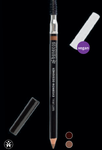
NATURAL EYEBROW-DESIGNER Mótar augnabrúnn með fullkomnum hætti. Bursti sem auðvelt er að nota.