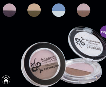
NATURAL AUGNSKUGGATVENNA · Litir sem tóna vel saman og eru sérvaldir til að draga enn frekar fram fegurð augnanna. Hvern lit má einnig nota einan og sér.