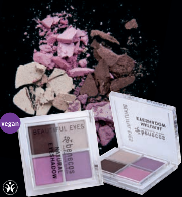
NATURAL AUGNSKUGGAFJARKI 4 litir af augnskuggum. Spennandi og töff samsetningarmöguleikar.