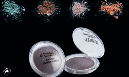
NATURAL BAKED COLOURS AUGNSKUGGAR glansandi og töff litir með mikilli perluáferð. Auðveldir í notkun, mjúk og silkikennð áferð.