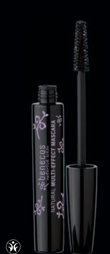
NATURAL MULTI EFFECT-MASCARA · Eykur þykkt, lengd og sveigju augnháranna.