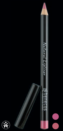
NATURAL VARABLYANTUR Til að móta fullkomnar útlínur og fallegar varir.