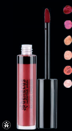
NATURAL VARAGLOSS Liturinn helst vel og nærir viðkvæmar varir.